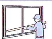
② 下枠と上枠を取付けます