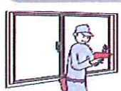
① たて枠を取付けます。